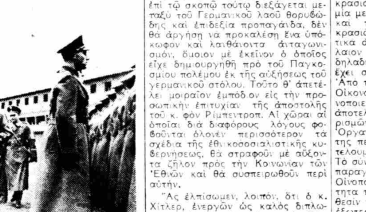
Ἡ πρόσφατα στρατιωτικὴ ἐπίσκεψις...