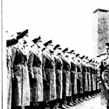
Ἡ πρόσφατα στρατιωτικὴ ἐπίσκεψις...