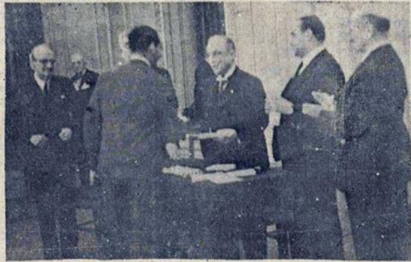
Ο κ. Πρωθυπουργός άπονέμων τ' ασχολικά βραβεία

Κυρίες και Κύριοι, Αισθάνομαι εξαιρετική χαρά και συγκίνηση διότι λαμβάνω μέρος στην τελετή αυτή όπου εύρίσκω συγκεντρωμένους σχεδόν όλους τους εκπροσώπους της ελληνικής πνευματικής και καλλιτεχνικής κινήσεως. Αυτή τη στιγμή (Συνέχεια στην 4η σελίδα)