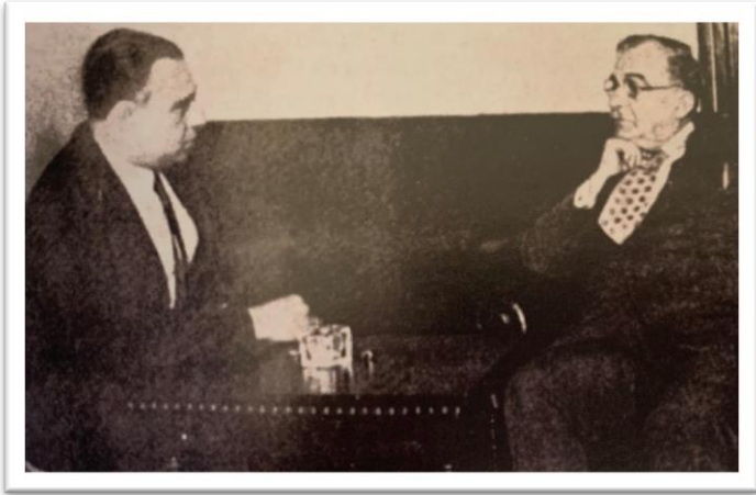
Ο Κωστής Μπασσιάς και ο Ιωάννης Μεταξάς

Τα Κρατικά Λογοτεχνικά Βραβεία ήταν ένας νέος θεσμός που για πρώτη φορά λειτουργήσε το 1939, επί κυβερνήσεως Ιωάννου Μεταξά, για βιβλία που είχαν εκδοθεί το 1938 και αφορούσαν την ποίηση, το μυθιστόρημα, το δοκίμιο και το θέατρο. Ο νέος θεσμός υπαγόταν στη Γενική Διεύθυνση Γραμμάτων και Καλών Τεχνών του Υπουργείου Θρησκευμάτων και Εθνικής Παιδείας, με γενικό διευθυντή τον Κωστή Μπασσιά, και στεγαζόταν, στην οδό Φωκίωνος 7, διατηρώντας κάποια ανεξαρτησία από το υπόλοιπο υπουργείο Παιδείας της οδού Ευαγγελιστρίας. Στο ίδιο κτίριο στεγαζόταν και η Διεύθυνση Καλών Τεχνών με διευθυντή τον Παντελή Πρεβελάκη. Το 1940