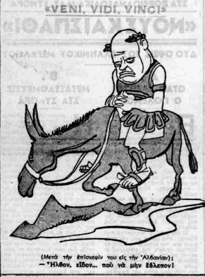
(Μετά την έπισημάνη του εις την 'Αλβανία) - 'Η δουν ειδων... πολό να μην έλλανον!