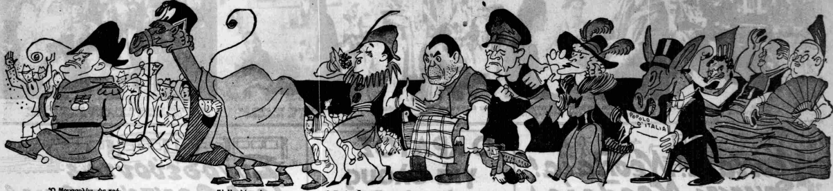
'Ο Μουσουλμάνος δε φέρει φορολογίαν... 'Η 'Ιταλία δε γκαρνταρνί... 'Ο Τσιούνης δε κολιούσι... 'Ο Καταλόρος δε χασί... 'Ο Γερμανός δε μα... 'Ενας δε μαντά... 'Ο Ρεκόνας δε ... δε... Πράσιος, Γερμανός και Σικανός δε χρίο καρτεζιού.