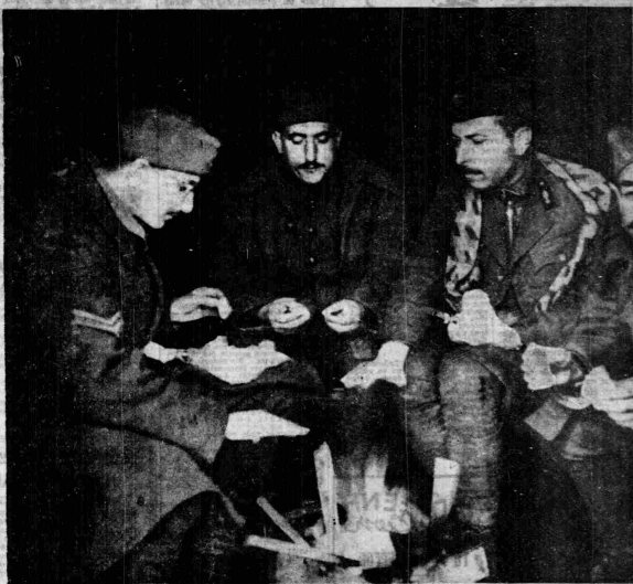
Ἀδελφοί μου, ἀνώτεροι καὶ κατώτεροι, ὁμοεταρχειακοὶ καὶ ὁμόλιτοι, μαρτύρομαι τοὺς κινδύνους τῆς μάχης καὶ τὸ λιτὸ γυθί- ον γύρω στὴν πρόχειρην φωτιά.