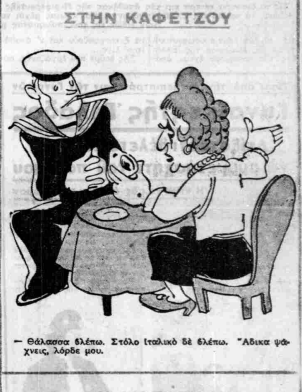
- Εθάρσιος έλλεμα. Στάλο ιταλικό δέ έλέμα. 'Αδικα φοχίνα, λάρβε μου.