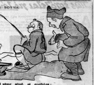
- Τι κάνας σάου, πρ' σου δόλωσε... - Τους άγκιστρώνου!