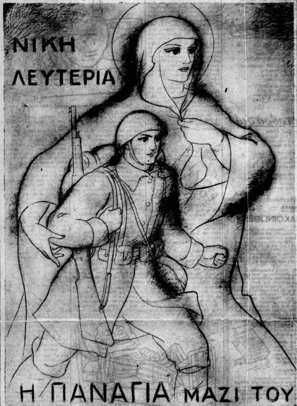
Ἔργον τοῦ ζωγράφου κ. Γουαρσοπούλου, ἐμπνευσμένον ἀπὸ τὴν ἔνθεον πίστιν καὶ οὐστρηλασίαν τῶν μαχομένων Στρατῶν μας πρὸς τὴν τελευτήν νίκην.

ΕΛΛΗΝΕΣ ΚΑΙ ΕΛΛΗΝΙΔΕΣ: Σφίξτε τὰ δόντια σας, χα- λυβδῶσατε τὴς ψυχῆς σας, καὶ ὄρθοι με τὰ μάτια πρὸς τὰ ἔμπρός, καὶ τὰ ὄπλα προτεταμένα στὴν καρδίᾳ τοῦ ἔχ- θροῦ, δώστε του, τοῦ ἀνάνδρου τὴν ἀπάντησιν, στὴ χι- ρὰ του διὰ τὸν θάνατον τοῦ Ἀρχηγοῦ.