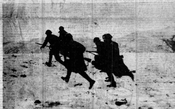
Ἐξοδος 1 Ἰσχυρὰ ἀπὸ τὴν προπροσπορευομένην ἔρσην τοῦ πυροβολικοῦ, οἱ φαντῆρες μας ἐξέρχονται γιὰ τὴν κατάληξιν τῶν θέσεων σπουδαίας στρατηγικῆς σημασίας. Κανένα ἐμπόδιον δὲν μπορεῖ νὰ τοὺς ἀυχαρηθῆν...