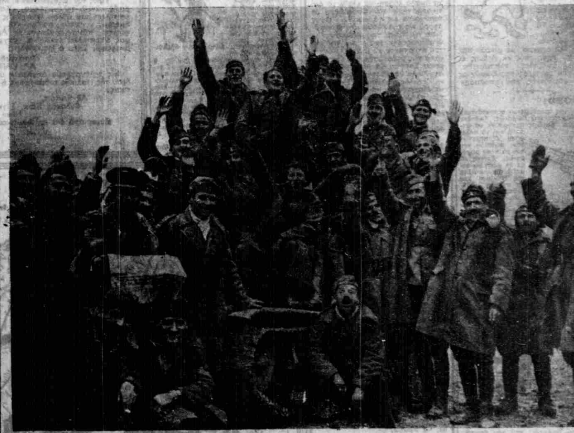
Ἡ εὐτυχία ἀπὸ τὴν ἐπίθεισιν... Ἀπό τὸν πεδίο πολεμικῆς ἐπιτυχίας, ἡ εὐτυχία ἔφρασαν εἰς τὴν Πόλιν, εἰς τὴν ἐπιπέδην καὶ εἰς τὴν ἐπιπέδην τῆς Κληρονομίας, φωτογραφούμενοι διὰ τὴν «ἔπαινον» ἐπὶ τὴν ἰταλικὴν πύλην. Λόγω τῶν τελευτήτων μαχῶν.