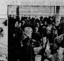
Στον περίβολο του Νοσοκομείου Μικράς Ασιας...