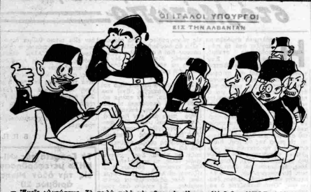
- 'Εμείς γλιτώσαμε. Τό πο λό καλό να πήμε αχμάλωτοι. Πά δοκιμα ΑΥΤΟΣ τι δά κάνει!