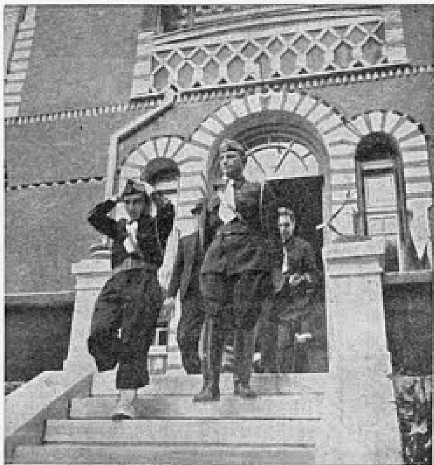
Ὁ Κυβερνητικὸς Ἐπίτροπος κ. Α. Κανελλόπουλος κατερχόμενος ἀπὸ τὴν οἰκίαν τοῦ Ἀρχηγοῦ ὅπου εἶχε μεταθῆ τὴν ἡμέραν τῆς ἐορτῆς του διὰ νὰ ὑποβάλῃ τὰς εὐχὰς του.

φωτογραφία του Αλέξανδρου Κανελλόπουλου, οικία Μεταξά στην Κηφισιά.