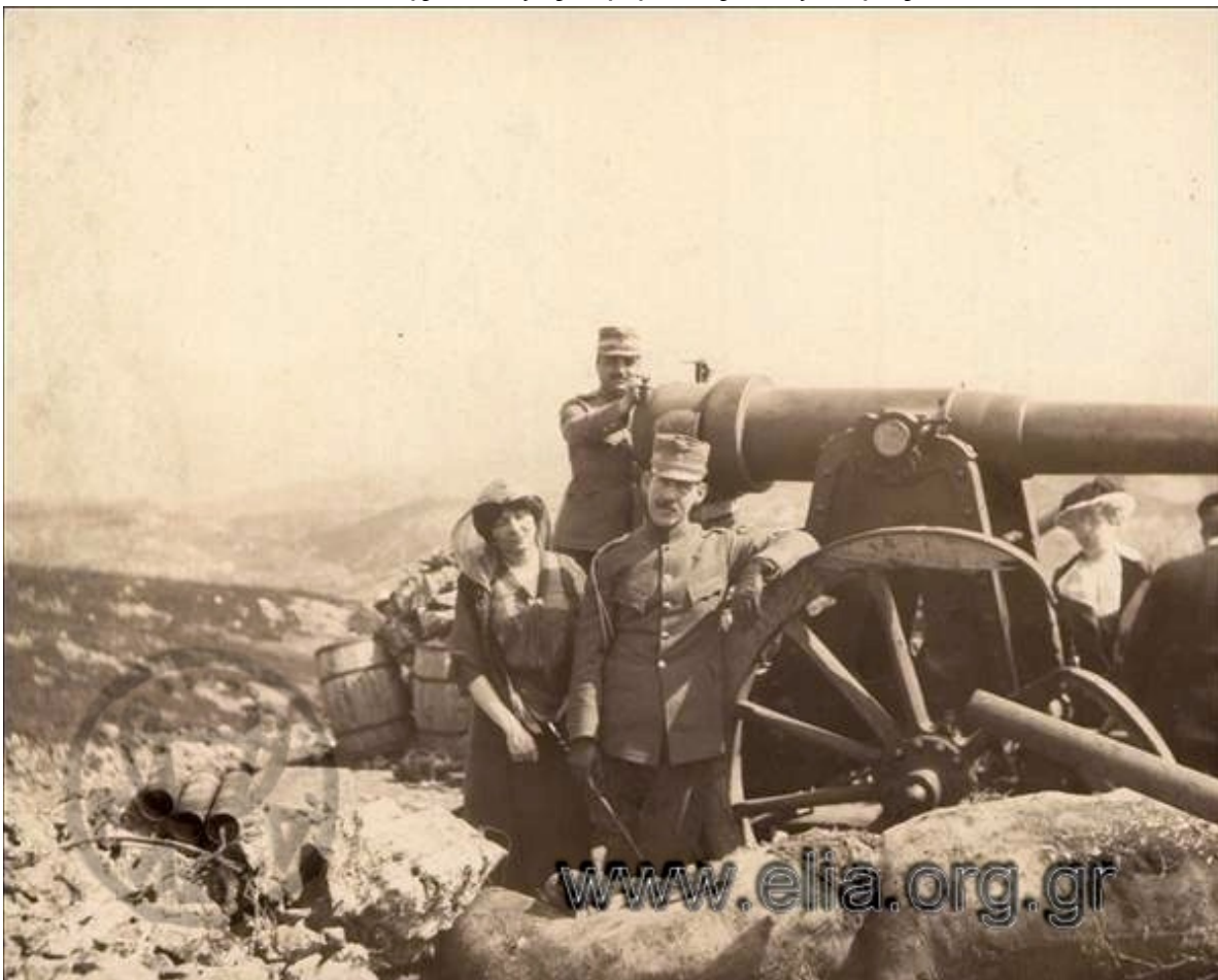
Ο διάδοχος Κωνσταντίνος και ο Ιωάννης Μεταξάς στο μέτωπο.