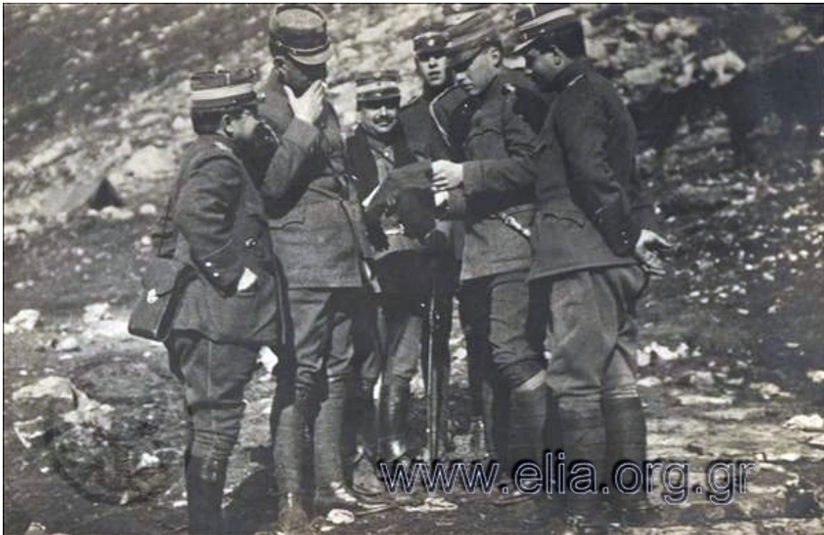
Ο διάδοχος Γεώργιος επιδεικνύει έγγραφο στο βασιλιά Κωνσταντίνο, Ξενοφών Στρατηγός, Ιωάννης Μεταξάς, πρίγκιπας Αλέξανδρος