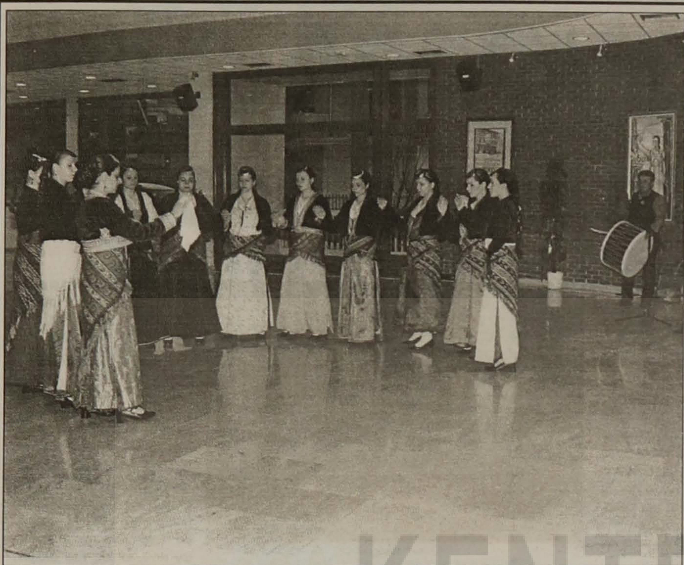
Τμήμα του γυναικείου χορευτικού συγκροτήματος της Ε.Λ.Β.