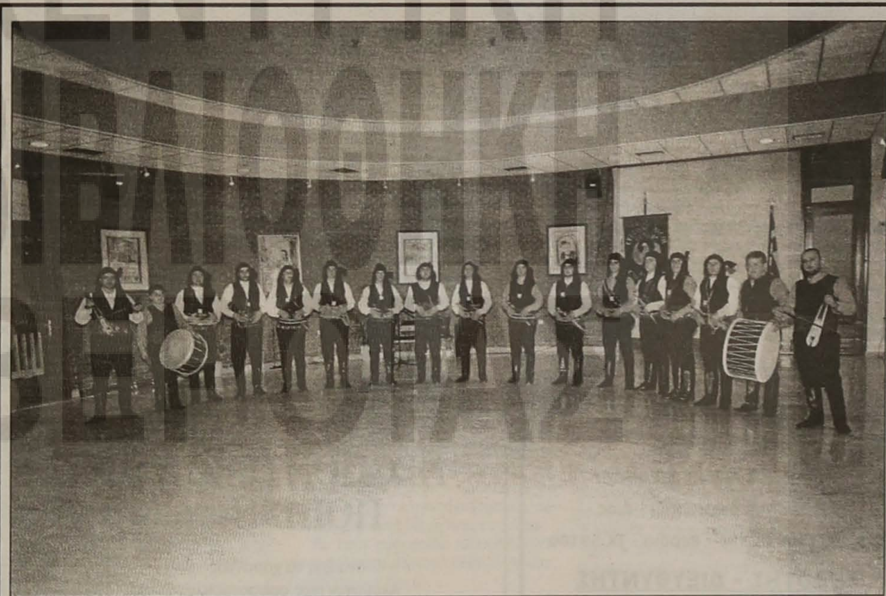
Τμήμα του ανδρικού χορευτικού συγκροτήματος της Ε.Λ.Β.