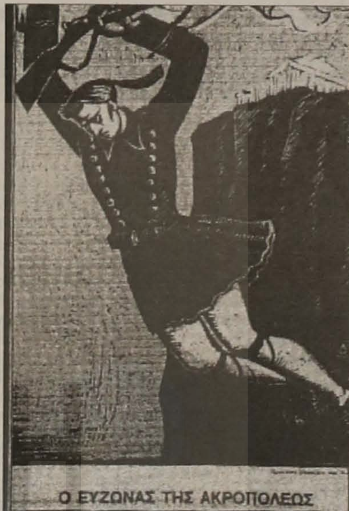
Ο ΕΥΖΩΝΑΣ ΤΗΣ ΑΚΡΟΠΟΛΕΩΣ

Καμαρώστε "αυτούς" που καίνε τη σημαία μας, για την οποία πολέμησαν και θυσιάστηκαν οι Πατέρες μας, αλλά προπάντων τιμήστε με αξιώματα -αλίμονο δέστε τα χάλια μας- ό-