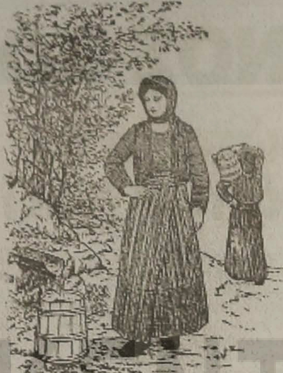
Η ΜΑΤΣΟΥΚΑΤΣΑ 'Ο Ο ΚΡΕΝΙΝ

- Θεία Ελένε, εντρέπουμαι να έρχουμαι ελάτεν επάρτε με.