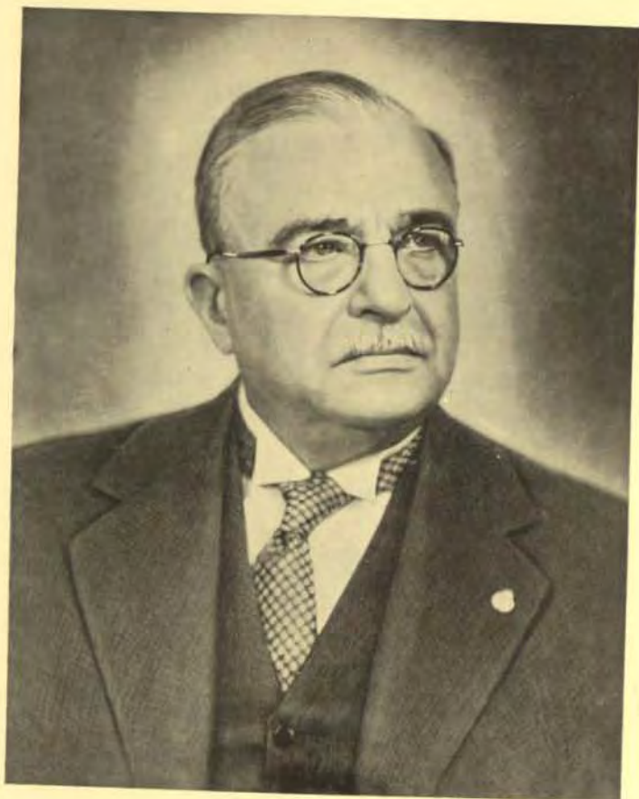
Ὁ Γω. Μεταξᾶς Κυβερνήτης.