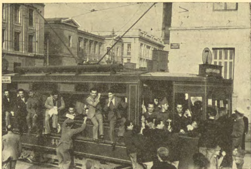
Ἡ ἐπιστράτευσις. Οἱ Ἕλληνες ἐπήγαιναν στὸν πόλεμο αὐτὸν σὰν σὲ πανηγύρι.