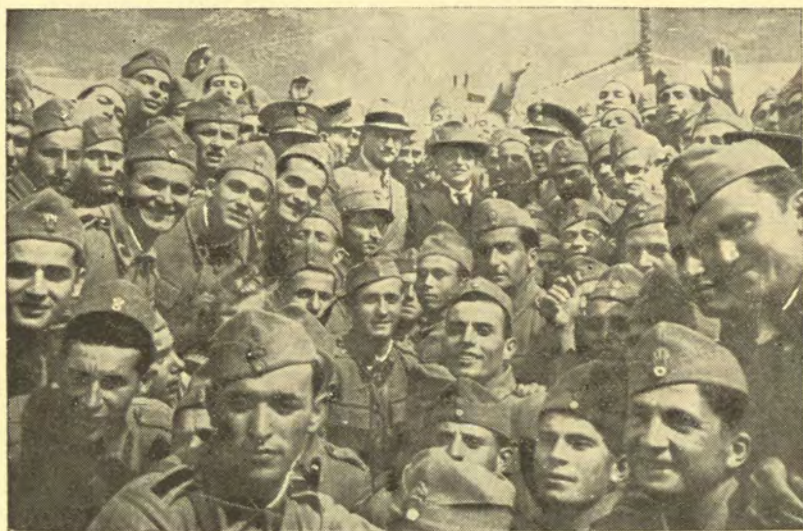
Ὁ Ἴω. Μεταξᾶς σὲ ἓνα στρατῶνα.