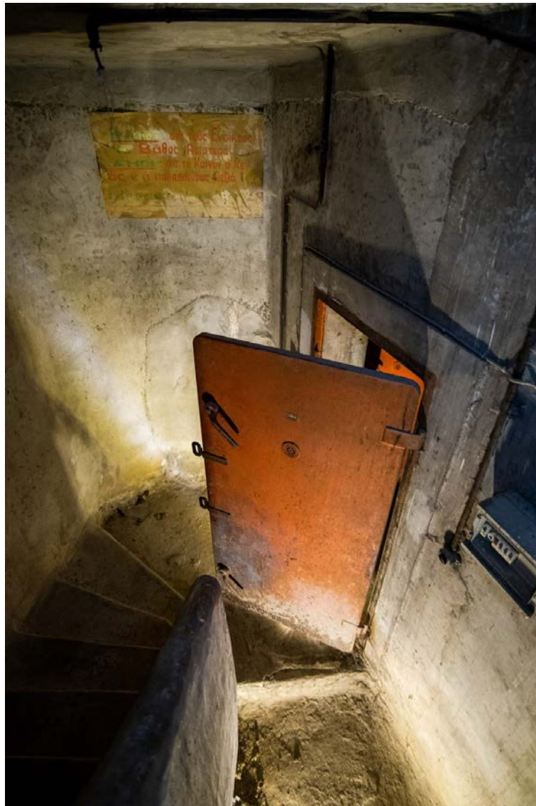
Μπροστά στην είσοδο καταφυγίου, κάτω από την οδό Ερμού.

Εκεί θα εξερευνήσουμε δύο θέματα: πρώτον, πώς το καθεστώς Μεταξά, προκειμένου να έχει αρκετά καταφύγια, θέσπισε τον υποχρεωτικό νόμο κατασκευής καταφυγίων σε όλες τις νεόδμητες οικοδομές και δεύτερον πώς ήταν το πλαίσιο της κοινωνικής ζωής στα καταφύγια αλλά και πώς επηρέαζε τους κατοίκους της πολυκατοικίας το να είναι στριμωγμένοι σε ένα καταφύγιο κάτω. Θα ασχοληθούμε με το πώς ήταν η ζωή στα καταφύγια και πώς επηρέασε κοινωνικά τους ανθρώπους το να βρίσκονται οι κάτοικοι της πολυκατοικίας στριμωγμένοι σε ένα καταφύγιο κάτω.