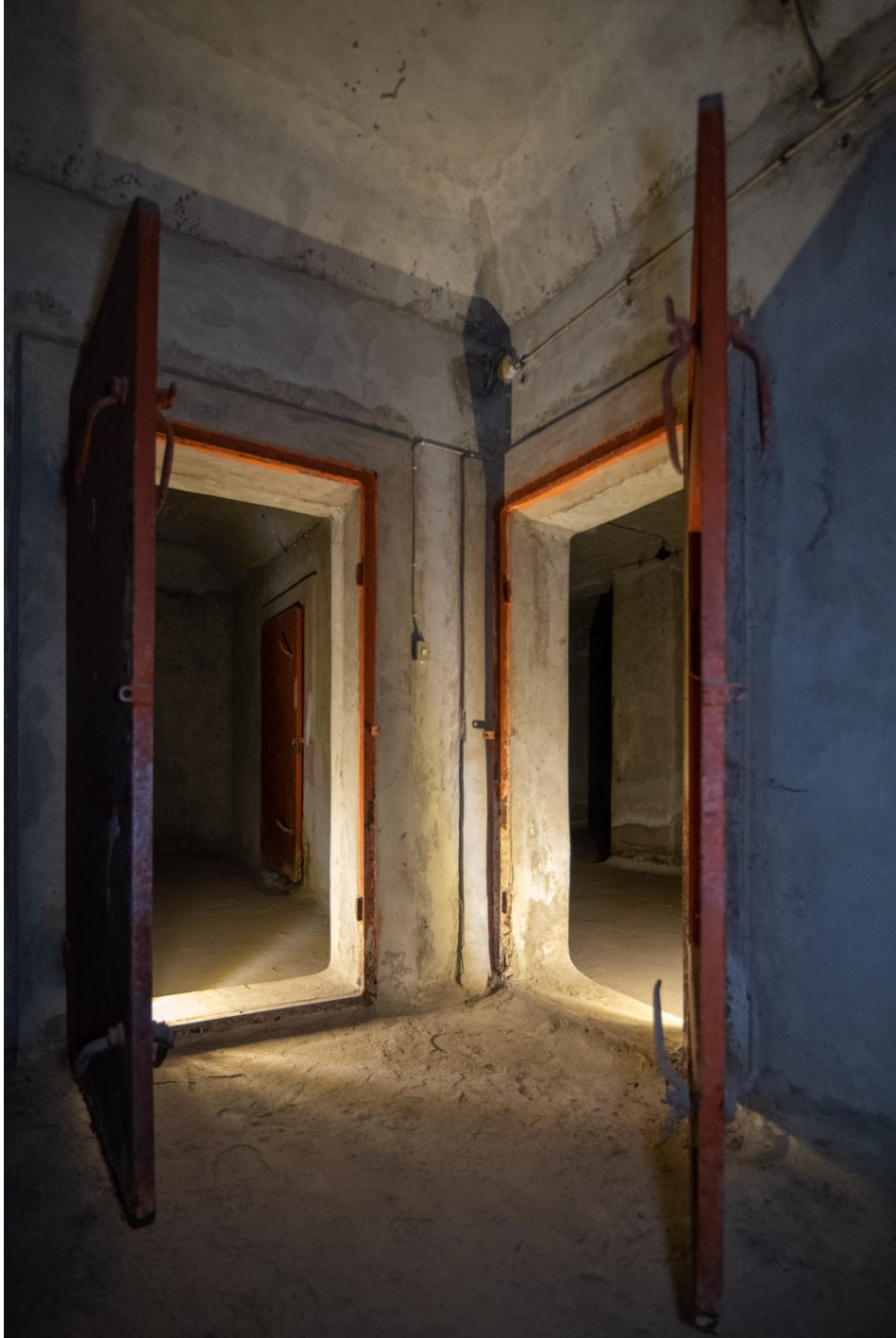
Ο προθάλαμος ενός καταφυγίου του 1938

Θέλουμε με αυτόν τον τρόπο να αναδείξουμε το γεγονός ότι κάποιοι χώροι, όπως τα καταφύγια, οι οποίοι δημιουργήθηκαν αρχικά για να προστατεύσουν τους Έλληνες, κατέληξαν εν μέσω Κατοχής, να είναι τόπος βασανισμού για τους Έλληνες. Τότε άλλαξε δυστυχώς η χρήση τους.