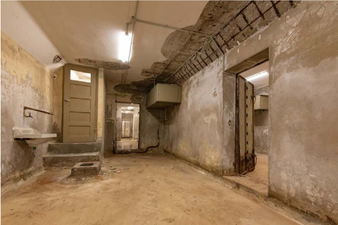
Υποδειγματικό καταφύγιο στο λιμάνι του Πειραιά. Στο βάθος διακρίνεται επιτοίχια μεταλλική υδατοδεξαμενή.

Με αφορμή τις επετειακές εκδηλώσεις του Δήμου Αθηναίων για τα 80 χρόνια από την απελευθέρωση της Αθήνας, κατεβαίνουμε στα καταφύγια του Β΄ Παγκοσμίου Πολέμου με οδηγό τον ερευνητή Κωνσταντίνο Κυρίμη.