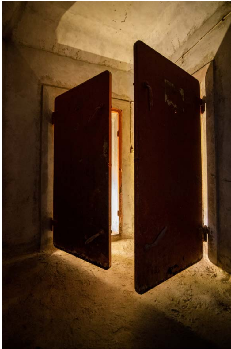
Οι θωρακισμένες πόρτες των καταφυγίων συχνά εισάγονταν από τη Γερμανία.

Η λογική της εκπαίδευσης φαντάζει μακρινή στο σύγχρονο ελληνικό κοινωνικό πλαίσιο. Το μοναδικό επίπεδο συναγερμού που γνωρίζουμε είναι αυτό τα κινητά μας με το 112 σε περίπτωση φυσικής καταστροφής, το οποίο δεν συνοδεύεται από οργανωμένη άσκηση ετοιμότητας.