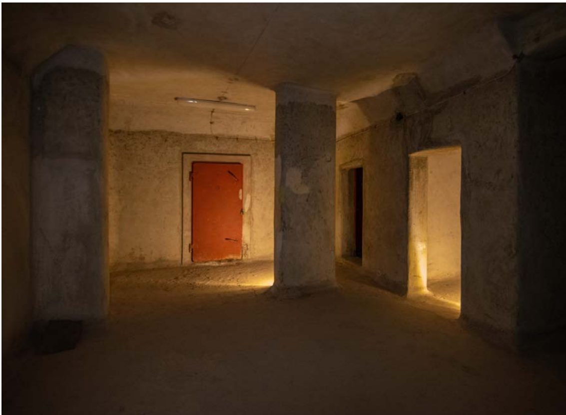
Κάθε θάλαμος καταφυγίου είχε μέγιστη χωρητικότητα 50 ατόμων.

Το καθεστώς Μεταξά δεν περιορίστηκε μόνο στην κατασκευαστική πτυχή των καταφυγίων, είχε αντιληφθεί εξαρχής ότι όσο καλά καταφύγια και να κατασκευάζονταν, αν δεν υπήρχε επαρκής εκπαίδευση του πληθυσμού, δεν θα λειτουργούσε το σύστημα της παθητικής αεράμυνας. Οπότε θα αναφερθούμε και στο κομμάτι της εκπαίδευσης, καθώς και σε μια πτυχή που δεν είναι ευρέως γνωστή της παθητικής αεράμυνας, που είναι η χειραφέτηση των γυναικών. Μέσω της εμπλοκής των γυναικών στα αγήματα παθητικής αεράμυνας, οι γυναίκες βγήκαν από το σπίτι, είχαν ένα πολύ πιο ενεργό ρόλο στην κοινωνία. Ο πολεμικός κίνδυνος στάθηκε η αφορμή για την χειραφέτηση των γυναικών εκείνη την εποχή.