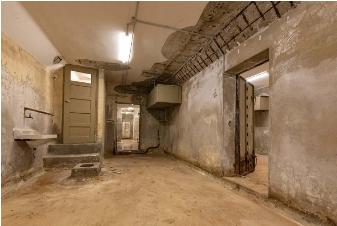
Υποδειγματικό καταφύγιο στο λιμάνι του Πειραιά. Στο βάθος διακρίνεται επιτοίχια μεταλλική υδατοδεξαμενή.

Υπήρχαν όμως και αντίθετες περιπτώσεις. Κυρίες της καλής κοινωνίας που παραπονιούνταν για αυτούς που δίπλα τους μύριζαν κτλ. Σίγουρα, πάντως, ήταν ένα μεγάλο ταξικό σοκ για την κοινωνία της εποχής.