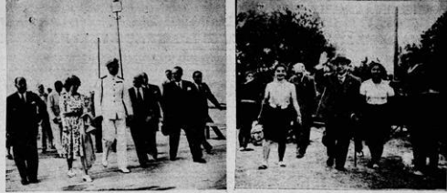
Στην εικόμα αριστερά ο βασιλιάς Γεώργιος Β΄ με τον βασιλικό οίκο. Στην εικόμα δεξιά ο βασιλιάς Γεώργιος Β΄ με τον βασιλικό οίκο.