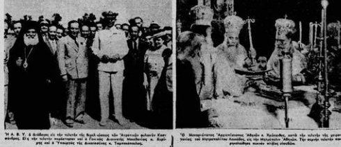
Ο βασιλιάς Γεώργιος Β΄ με τον βασιλικό οίκο. Στην εικόμα δεξιά ο βασιλιάς Γεώργιος Β΄ με τον βασιλικό οίκο.