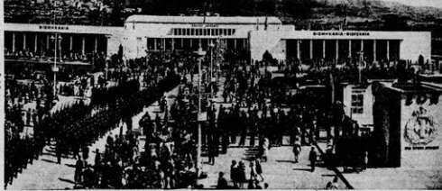
Αίμα στα πελάγια του Αιγαίου. Ο βασιλιάς Γεώργιος Β΄ με τον βασιλικό οίκο. Στην εικόμα δεξιά ο βασιλιάς Γεώργιος Β΄ με τον βασιλικό οίκο.