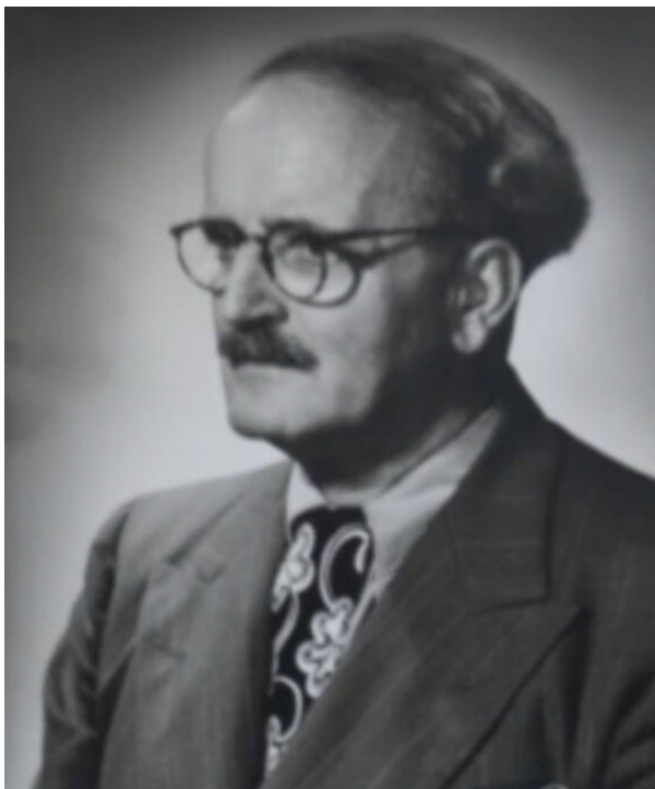
Ο Κωνσταντίνος Κοτζιάς

Τον Σεπτέμβριο του 1936 ο διαβόητος Υπουργός Προπαγάνδας της Γερμανίας Γκέμπελς έκανε επίσκεψη στην Ελλάδα, στη διάρκεια της οποίας συναντήθηκε με τον Ιωάννη Μεταξά και επιφανή στελέχη του καθεστώτος, όπως τον Κωνσταντίνο Κοτζιά. Ο Γκέμπελς επιζητούσε στενότερη συνεργασία με την Ελλάδα, ενώ δημόσια έκανε δηλώσεις θαυμασμού για τον αρχαίο ελληνικό πολιτισμό. Μετέφερε επίσης την άποψη του Χίτλερ ότι στις φλέβες των σύγχρονων Ελλήνων κυλά τευτονικό αίμα, άρα υπάρχει συγγένεια μεταξύ των δύο λαών. Στους Ολυμπιακούς Αγώνες του 1936 στο Βερολίνο καθιερώθηκε για πρώτη φορά η αφή της ολυμπιακής φλόγας στην αρχαία Ολυμπία.