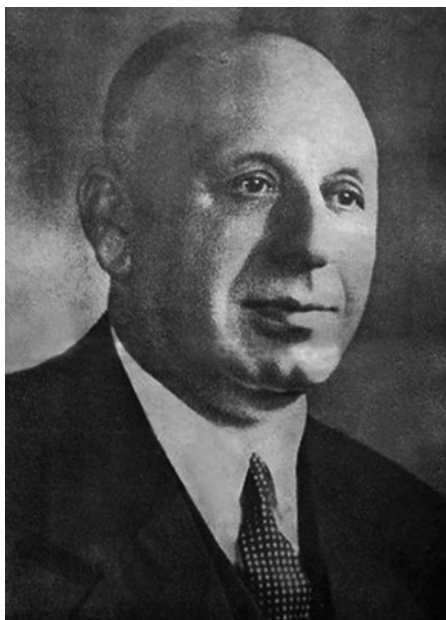
Ο Κωνσταντίνος Μανιαδάκης

Κωνσταντίνος Μανιαδάκης: ο αθηνής διώκτης του Κ.Κ.Ε. και «άγρυπνος φρουρός» του καθεστώτος της 4ης Αυγούστου