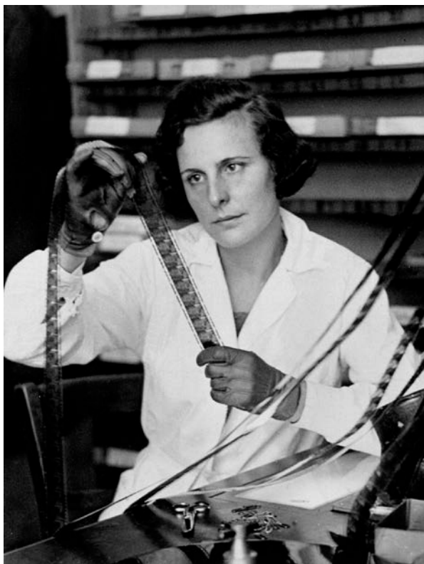
Η Leni Riefenstahl το 1935

Μεταξύ 1936-1939 αυξήθηκαν κατακόρυφα οι ελληνικές εξαγωγές στη Γερμανία με τη μέθοδο του κλίρινγκ, ιδιαίτερα στα καπνά, έτσι ώστε τα τέλη του 1938 η Γερμανία να είναι ο πρώτος εμπορικός εταίρος της Ελλάδας, εκτοπίζοντας τη Μ. Βρετανία. Οι προσπάθειες όμως των Γερμανών να εντάξουν την Ελλάδα στη σφαίρα επιρροής του Άξονα απέτυχαν, κυρίως λόγω του βασιλιά Γεωργίου Β', ο οποίος κατά τη διάρκεια της παραμονής του στην Αγγλία είχε μεταβληθεί σε φανατικό οπαδό του μεγαλείου της. Είναι χαρακτηριστικό, ότι είχε βαθιά απέχθεια τόσο για τη ναζιστική Γερμανία, όσο και για τον Αδόλφο Χίτλερ . Δεν τηρούσε μάλιστα ούτε τα διπλωματικά προσχήματα. Δεν συνάντησε τον Γκέμπελς όταν ήρθε στην Ελλάδα, ούτε και τον Χίτλερ, παρά τις προτροπές του Μεταξά, όταν πέρασε από τη Γερμανία σε ένα ταξίδι του στο εξωτερικό.