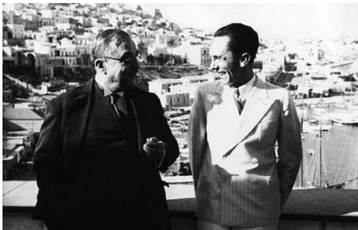
Μεταξάς και Γκέμπελς στην Καστέλλα το 1936

Τον Σεπτέμβριο του 1936 ο διαβόητος Υπουργός Προπαγάνδας της Γερμανίας Γκέμπελς έκανε επίσκεψη στην Ελλάδα, στη διάρκεια της οποίας συναντήθηκε με τον Ιωάννη Μεταξά και επιφανή στελέχη του καθεστώτος, όπως τον Κωνσταντίνο Κοτζιά. Ο Γκέμπελς επιζητούσε στενότερη συνεργασία με την Ελλάδα, ενώ δημόσια έκανε δηλώσεις θαυμασμού για τον αρχαίο ελληνικό πολιτισμό. Μετέφερε επίσης την άποψη του Χίτλερ ότι στις φλέβες των σύγχρονων Ελλήνων κυλά τευτονικό αίμα, άρα υπάρχει συγγένεια μεταξύ των δύο λαών. Στους Ολυμπιακούς Αγώνες του 1936 στο Βερολίνο καθιερώθηκε για πρώτη φορά η αφή της ολυμπιακής φλόγας στην αρχαία Ολυμπία.