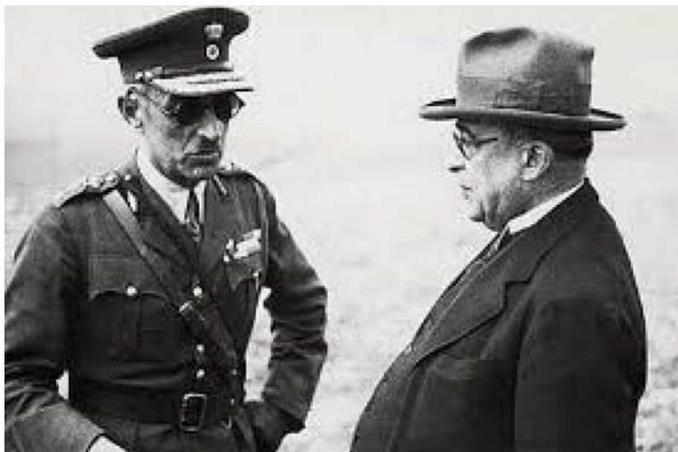
Μεταξάς και Παπάγος

Η συνωμοσία των γερμανόφιλων εκδηλώθηκε στις 3 Ιουνίου 1940. Τότε, ο Υπαρχηγός ΓΕΣ, Υποστράτηγος Πλατής, ο οποίος υπήρξε Υφυπουργός Στρατιωτικών στην κυβέρνηση Κωνσταντίνου Δεμερτζή, ζήτησε επίσημα την αντικατάσταση του Αλέξανδρου Παπάγου στην ηγεσία του Στρατού, καθώς δήθεν είχε ενημερωθεί από διπλωματικούς κύκλους ότι δεν ήταν αρεστός στη Γερμανία. Ο Παπάγος ενημέρωσε σχετικά τον Μεταξά προσθέτοντας ότι θα ήταν μάλλον απίθανο η Γερμανία να εκφράσει τέτοιου είδους απόψεις, χωρίς να χρησιμοποιήσει την επίσημη διπλωματική οδό. Αυτή ήταν και η αφορμή που αναζητούσε ο Μεταξάς για να «ξεκαθαρίσει» την κατάσταση με τους γερμανόφιλους οριστικά και αμετάκλητα. Με μια σκληρή κίνηση μέσω των μηχανισμών