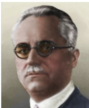
Ο Σωτήριος Γκοτζαμάνης

Ισχυρότερος όλων, ο απόστρατος Συνταγματάρχης Θεόδωρος Σκυλακάκης, στενός συνεργάτης και φίλος του Μεταξά από την εποχή του κινήματος Γαργαλίδη - Λεοναρδόπουλου (1923) και φανατικός αντιβενιζελικός. Υπήρξε στέλεχος των «Ελευθεροφρόνων» (του κόμματος που είχε ιδρύσει ο Ι. Μεταξάς πριν την 4η Αυγούστου) και Υπουργός του αυγουστιανού καθεστώτος. Αποπέμφθηκε όμως τον Δεκέμβριο του 1936 ως μέλος συνωμοσίας κατά του καθεστώτος. Από τότε ήταν σε στενή επαφή με τη γερμανική πρεσβεία, αλλά και υπό συνεχή παρακολούθηση της ελληνικής μυστικής Αστυνομίας. Άλλο κορυφαίο στέλεχος των συνωμοτών ήταν ο Θεόδωρος Τουρκοβασίλης, φανατικός γερμανόφιλος και υπαρχηγός των «Ελευθεροφρόνων» ως το 1935. Υπέρ της Γερμανίας κινούνταν επίσης παλαιοί αντιβενιζελικοί πολιτευτές, όπως ο Πέτρος Ράλλης, ο Περικλής Ράλλης και ο Σωτήριος Γκοτζαμάνης που διορίστηκε από τους Γερμανούς Υπουργός Οικονομικών στη διάρκεια της Κατοχής.