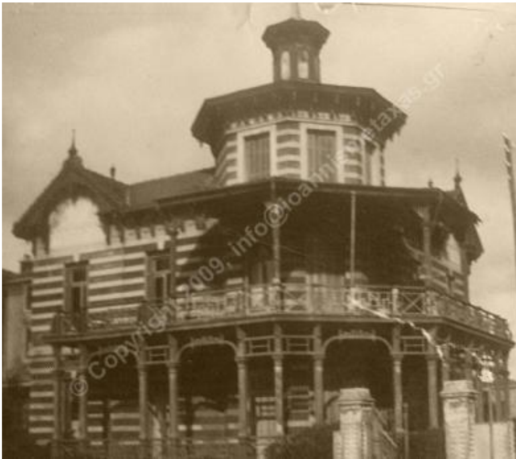
Οικία Μεταξά, Ν.Φάληρο 1921

Η απόφαση και η απάντηση που έδωσε τον Μάρτιο του 1921 δεν είναι μόνο το αποτέλεσμα των συζητήσεων και η απόφαση εκείνων των δύο συναντήσεων. Στο Ημερολόγιο του παρατηρούμε ότι από την αρχή του μήνα περιμένει αυτή την πρόκληση και είναι έτοιμος να απαντήσει. Δηλώνει πάντου εκ των προτέρων την αποφασή του απερίφραστα όπου δημιουργείται η σχετική προτροπή ή συζήτηση περί της αναμείξεως του στην Μικρασιατική Εκστρατεία. Πρόκειται επομένως για μία ώριμη απάντηση από καιρό αυτό που ανακοινώνει στις 29 και όχι κάτι που προέκυψε εκείνη την ημέρα ή μετά από τις σχετικές προτάσεις, πιέσεις ως και απειλές τις οποίες του απεύθυναν ως εξουσία οι Δημήτριος Γούναρης, Ν. Θεοτόκης και Πέτρος Πρωτοπαπαδάκης. Αξίζει όμως να δούμε τα γεγονότα από την αρχή του Μαρτίου κάθε μέρα.