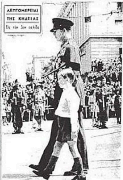
ΑΕΡΟΜΕΡΕΙΑΙ ΤΗΣ ΚΗΔΙΑΣ Είς τήν 3ην αεροδρομίου