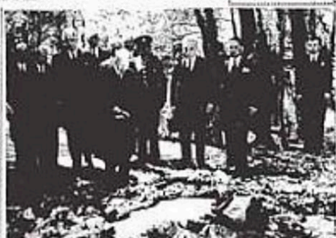
Ἡ ἐπισημειωθεὶς ἐπισημὴ ἀναφορὰ εἰς τὴν 6ην ἡμέραν τοῦ 1947, ἔχει ἰσχυρὰ ἐθνικὰ χαρακτηριστικά. Ἐπισημὴ τῆς ἐλευθερίας καὶ τῆς ἀνεξαρτησίας τοῦ ἑλληνικοῦ λαοῦ, ἔχει τὴν ἐπισημότητα τῆς ἐλευθερίας καὶ τῆς ἀνεξαρτησίας τοῦ ἑλληνικοῦ λαοῦ.

Ἡ ἐπισημειωθεὶς ἐπισημὴ ἀναφορὰ εἰς τὴν 6ην ἡμέραν τοῦ 1947, ἔχει ἰσχυρὰ ἐθνικὰ χαρακτηριστικά. Ἐπισημὴ τῆς ἐλευθερίας καὶ τῆς ἀνεξαρτησίας τοῦ ἑλληνικοῦ λαοῦ, ἔχει τὴν ἐπισημότητα τῆς ἐλευθερίας καὶ τῆς ἀνεξαρτησίας τοῦ ἑλληνικοῦ λαοῦ. Ἡ ἐπισημότητα τῆς ἐλευθερίας καὶ τῆς ἀνεξαρτησίας τοῦ ἑλληνικοῦ λαοῦ, ἔχει τὴν ἐπισημότητα τῆς ἐλευθερίας καὶ τῆς ἀνεξαρτησίας τοῦ ἑλληνικοῦ λαοῦ.