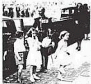
Ἡ ἐπισημειωθεὶς ἐπισημὴ ἀναφορὰ εἰς τὴν 6ην ἡμέραν τοῦ 1947, ἔχει ἰσχυρὰ ἐθνικὰ χαρακτηριστικά. Ἐπισημὴ τῆς ἐλευθερίας καὶ τῆς ἀνεξαρτησίας τοῦ ἑλληνικοῦ λαοῦ, ἔχει τὴν ἐπισημότητα τῆς ἐλευθερίας καὶ τῆς ἀνεξαρτησίας τοῦ ἑλληνικοῦ λαοῦ.

ΕΙΣ ΤΗΝ 6ΗΝ ΗΜΕΡΑ: Ο ἄγγελος τοῦ ἐντὸς τοῦ ἑεροδρομίου ΑΓΙΟΣ ΓΟΥΡΓΟΥΡΙΟΣ ΚΑΤΑ ΤΗΣ ΕΛΛΑΔΟΣ Ο κ. κ. Βενιζέλος, Κωνσταντίνος εἰς τὴν ἑλλάδα. Αἱ ἐπισημότητες καὶ τὴν ἀνεξαρτησίαν Οἱ ἐλευθεροὶ ἑλληνοὶ ἐπὶ τὴν 6ην ἡμέραν τοῦ 1947. ΣΥΝΕΧΙΖΕΤΑΙ ΤΟ ΑΔΙΕΞΟΔΟΝ ΕΙΣ ΤΗΝ ΔΙΑΣΚΕΨΗΝ ΤΗΣ ΜΟΣΧΑΣ