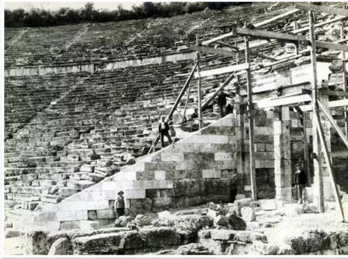
Φωτογραφία από τα έργα αναστήλωσης της δυτικής πύλης του Αρχαίου Θεάτρου της Επιδαύρου.

Το αρχαίο θέατρο της Επιδαύρου, που έχει χαρακτηριστεί ως μνημείο Παγκόσμιας Πολιτιστικής Κληρονομιάς από την UNESCO, θεωρείται το τελειότερο αρχαίο ελληνικό θέατρο από άποψη ακουστικής και αισθητικής. Κατασκευάστηκε από τον αρχιτέκτονα Πολύκλειτο τον Νεότερο σύμφωνα με όσα αναφέρει ο Πausanias με την μέγιστη χωρητικότητα θεατών στην Επίδαυρο να φτάνει τους 13.000 – 14.000 και την παράσταση «Ηλέκτρα» του Σοφοκλή να αποτελεί την πρώτη παράσταση της σύγχρονης εποχής της.