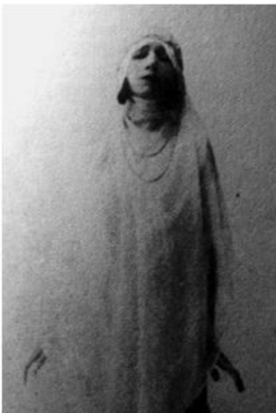
Μαρίκα Κοτοπούλη, Κλυταιμνήστρα το 1918.

Και οι τρεις μεγάλες, και οι τρεις αλησμόνητες μέσα από τις ερμηνείες τους, και μέσα από τα κείμενα που έχουν γραφτεί για αυτές, αλλά και με βάση τις διηγήσεις εκείνων που είχαν την τύχη να τις δουν στη σκηνή.