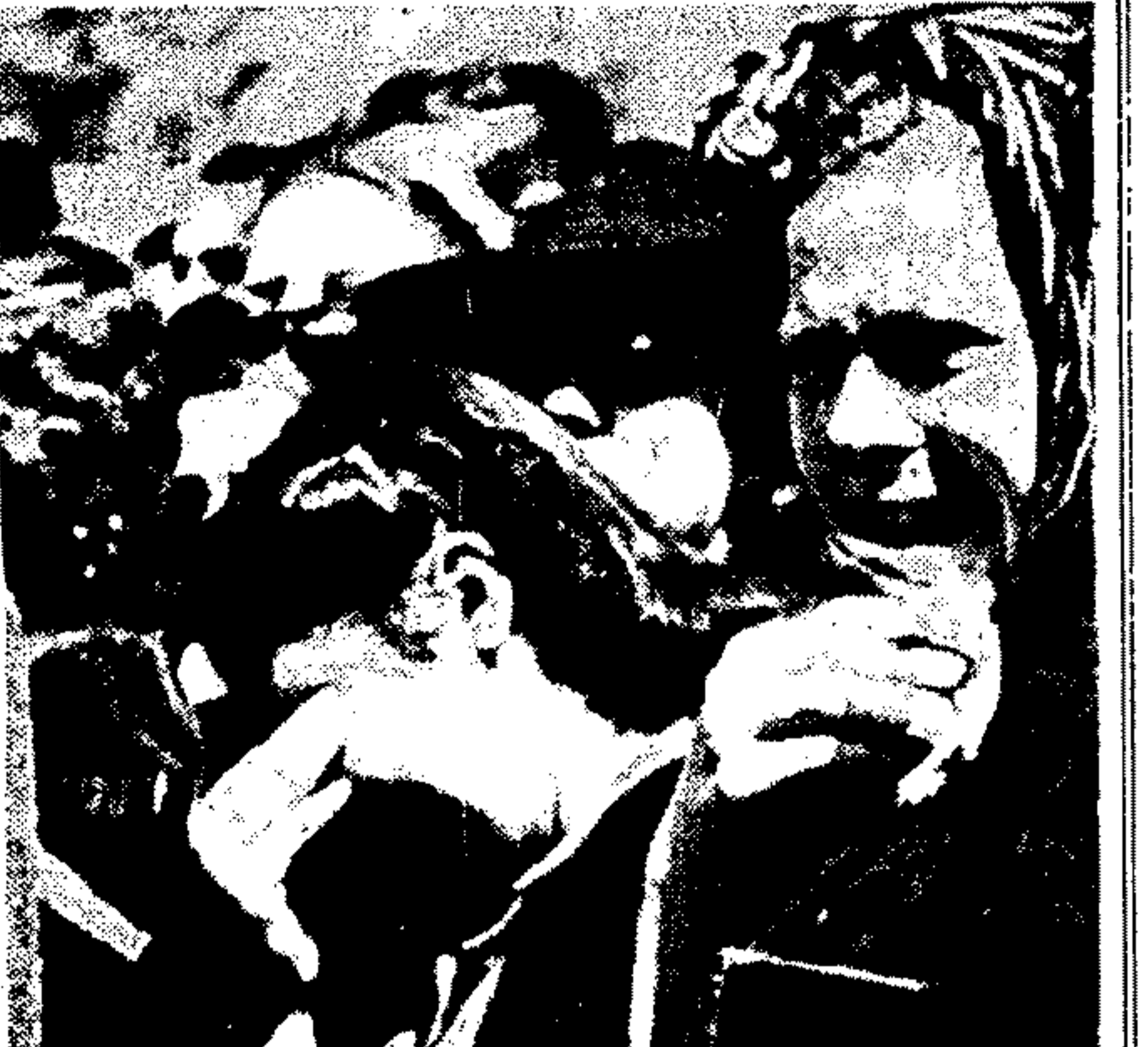
Με δούλην και θλιψίν, με δούλην και θλιψίν... Με δούλην και θλιψίν, με δούλην και θλιψίν...