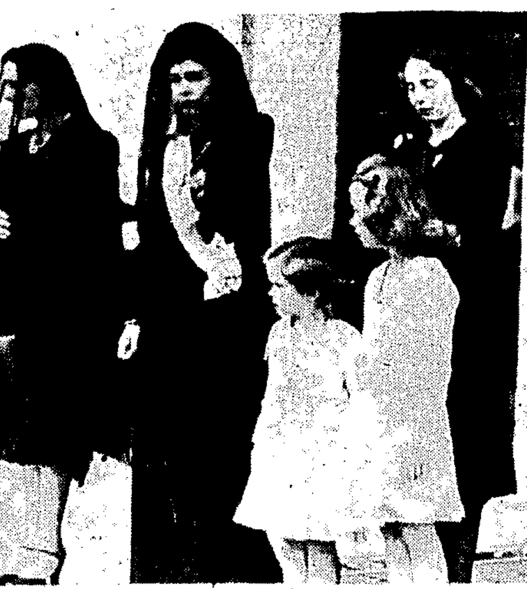
Η Βασιλομήτωρ της Ρουμανίας, πριγκίπισσα Έλενη της Ελλάδος... Η Βασιλομήτωρ της Ρουμανίας, πριγκίπισσα Έλενη της Ελλάδος...