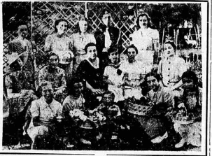
Ἡ δοξολογία τοῦ κ. Πρωθυπουργοῦ κ. Ἀλέξ. Μεταξά εἰς τὴν ἀνδοτικὴν ἐκθεσὴν Κηφισιάς

Ἡ πλοκή τῶν ἐπισημῶν πλοῦν τῆς καλοῦρας ἡμέρας Αἰῶν, ἀπὸς εἰς πλῆθος. Ἰδίως εἰς τὴν ἑσπέραν, πᾶς αὐτὴ ἡμέρα ἀνεβῆ ἀπὸ τὴν ἀντίληψιν τῶν ἐπισημῶν καὶ ἀπὸ τὴν εὐνομένην καὶ πολυήμερον.