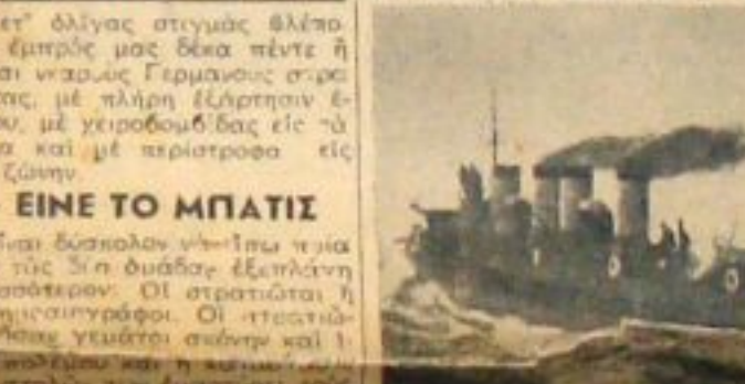
Τα ρωσικόν τερμολλοδέων άντερωματιών εις νωμισχίν τρία ισπανικά πελαγικά θωβόνα υπό τών δύο έννεκων άντων εν ζωή κινήσει των.

ΠΕΡΙΛΗΨΙΣ ΤΩΝ ΠΡΟΗΓΟΥΜΕΝΩΝ... (Summary of the Russian Civil War article)