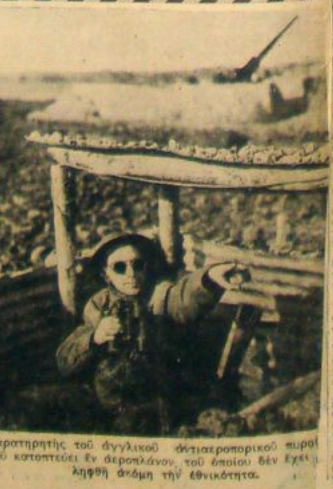
Παρατηρητής του αγγλικού αντιαεροπορικού πυροκού καταπέσει εν αεροπλάνου, τού όποιου δεν έχει ληψη ακόμη τήν ένδοξητητα.

Είς τήν περιθώριον... (News items and reports)