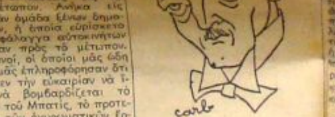
ΜΠΙΓΚΚΑΡ, πρόην νεμάρχη κατηχηροσύνης έπι καταχρηστί, προεπίστη τών κερμηνοεινών.