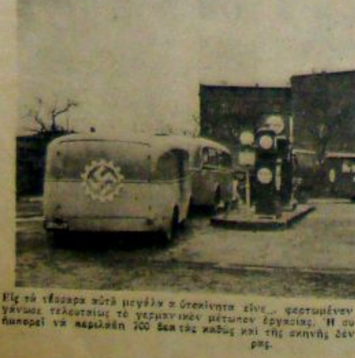
Είς τήν έκδοσιν από μινάκια ο σκελετός είναι φορητόμενον τό κινητόν θέατρον μετ' όρ- γανώσεως τελευταίας της γερμανικόν μέγανον έργασίας. Η ανημερόνιστος της ίδιούσιν που ήσκησε να κερδίσει 100 δακάτας καθ' οι τής σκηνης δέν διακρίνει είρη μόνον όλίγας δ. ρας.