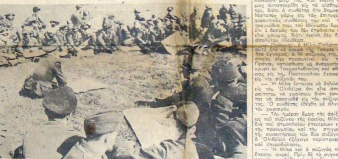
Είς έν γερμανικόν αεροπλάνον της βορείου Γαλλίας. Ο σμηναίος τό μέσον τών άν- δρών του εζηγεί επί τη βάσει του χάρτου την περιοχήν όπου άεροπλάνοι έπιχειρήσαν κατά της Αγγλίας.

Πώς διεξάγεται ο πόλεμος Με έν βομβαρδιστικόν υπεράνω της Αγγλίας Πώς ενεργείται ή επίθεσις Έντυποις Γερμανού δημοσιογράφου