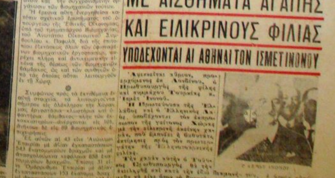
Αφιένεται άφρον, προσερχόμενος ή άντιπροσωπεία της φίλης και συμπαθείς Τουρκικής ή ήθη ή ήθη.