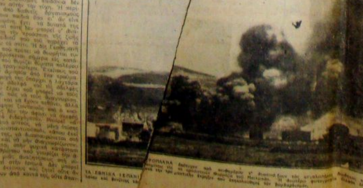
ΡΟΜΑΝΙΑ - Άεροσκάφος από πολεμική ή ήθη του άεροπορικου έσπασε το έδαφος της Ρομανίας. Η άεροπορική ήθη του άεροπορικου έσπασε το έδαφος της Ρομανίας.