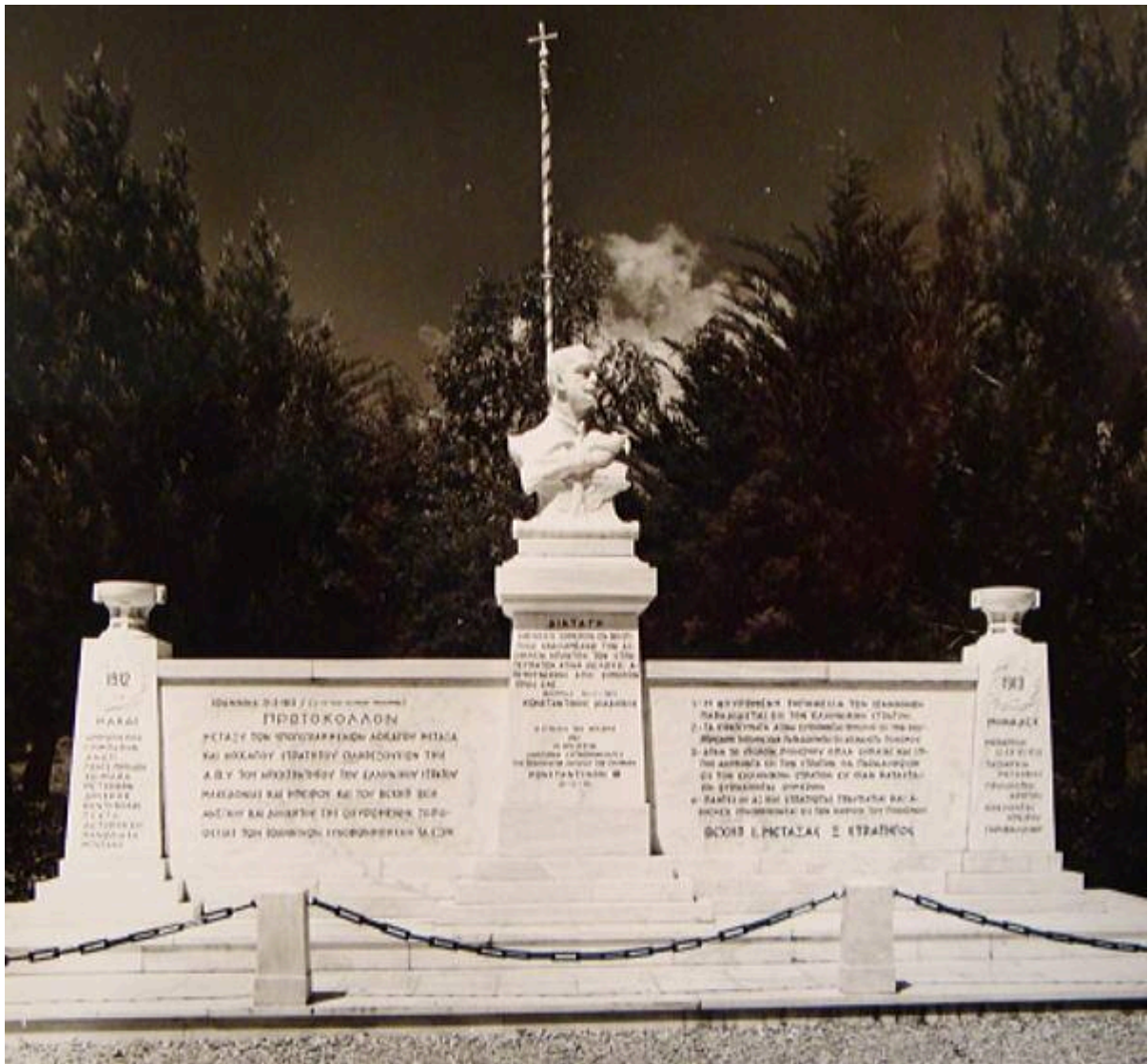
Πρωτόκολλο Παραδόσεως - Παραλαβής των Ιωαννίνων υπογεγραμμένο από Ξενοφόντα Στρατηγό και τον Ιωάννη Μεταξά