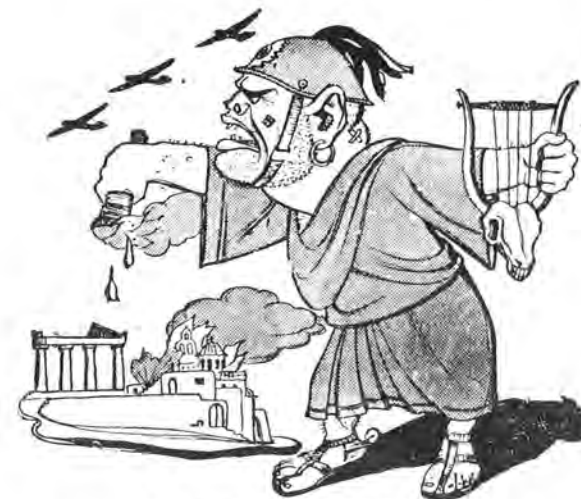
Ο ΝΕΡΩΝ ΤΟΥ 20οῦ Αἰώνος

«Τί σκέσιν ἔχουν αὐτὰ μετὰ τὴν παροῦσαν κατάστασιν κ. Ρομέο; Ἦλθατε ἐδῶ νύκτα. Μετὰ πλῆθος στρατιωτῶν καὶ φιερώων καὶ μηχανοκινήτων φαλάγγων. Τί πθέλατε;... Ἦθέλατε νὰ πάρετε τὴν Ἑλλάδα. Διότι ἐνομοίσατε ὅτι ἡ Ἑλλάς εἶναι Ἀθησοῦνία 'μὲ κανὲν ἴκνος πολιτισμοῦ'. Δὲν εἶν' ἔτσι; Τώρα λοιπὸν θὰ μάθετε πῶς τὰ πράγματα δὲν εἶναι ἔτσι. Θὰ μάθετε ὅτι δὲν ἔχομεν εἰς τὴν Ἑλλάδα πολιτισμὸν, ὅτι δὲν ἔχομεν εἰς τὴν νεωτέραν Ἑλλάδα μνημεῖα — ὅπως ἔχετε σεις λ.χ. τὸ Μνημεῖον τοῦ Ἀγνωστοῦ Στρατιώτου σας, τὸ ὁποῖον θὰ ἐντρέποντο νὰ ἔχουν κατασκευάσει οἱ μαρμαράδες τῶν Ἀθηνῶν —, ὅτι πράγματι εἰς διάστημα ἑκατὸν ἐτῶν ἐλευθέρως ζωῆς δὲν κατωρθώσαμεν νὰ δημιουργήσωμεν νέον πολιτισμὸν ἀνώτερον ἐκείνου τὸν ὁποῖον μᾶς ἐκληροδότησαν οἱ πατέρες μας: Ἀλλ' ὅτι ἐκρατίσαμεν ἀπὸ ἐκείνους, ἱερὰν παρακαταθήκην, τὸν ἐμπαθῆ ἔρωτα τῆς Ἐλευθερίας, μίαν λέξιν ἀπὸ τὰ κείλη τοῦ ἀγγέλου τοῦ Μαραθῶνος, ἕνα ἴκνον ἀπὸ τὸν παιάνα τῆς Σαλαμίνας. Καὶ ὅτι μετὰ τὸν πολιτισμὸν αὐτὸν, καὶ μετὰ