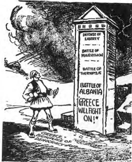
Addition to an Old Masterpiece

Ο άγγλοσαξωνικός Τύπος δεν παρέλειπε, κατά τον πόλεμο, να παινεύει την Ελλάδα και τον έλληνικό ήρωισμό με τὴ δημοσίευση επαινετικῶν άρθρων και ζωγραφικῶν συνθέσεων, ὅπου ὁ στρατιώτης τοῦ '40 ἀνακρυσσόταν ἰσάξιος τῶν μαχητῶν τοῦ Μαραθῶνος, τῆς Σαλαμίνας και τῶν Θερμοπυλῶν.