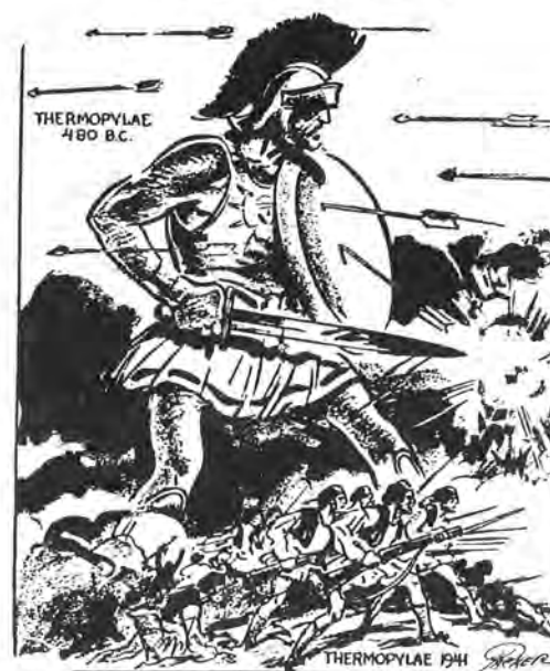
The Same Battlefield

Τὰ μάρμαρα τοῦ Παρθενῶνος χρησιμοποιήθηκαν ἐπίσης ἀπὸ τὴν ἀγγλικὴ πολιτικὴ για να τονώσουν τὸ φρόνημα τῶν Ἑλλήνων. Ὅπως συμβαίνει πάντοτε με μονότονη σταθερότητα, ἀπὸ τὸ Λονδίνο ἐφθασαν σπὴν Ἀθήνα πληροφορίες «ἐγκυρης πηγῆς», ὅτι «ἡ ἑλληνοαγγλικὴ συμμαχία δὲ ἡδύνατο μεταξὺ τῶν ἄλλων συνεπειῶν της να θέσῃ τέρμα εἰς τὸ ζήτημα τὸ ὁποῖον ἀπὸ μακροῦ χρόνου εἶχεν ἀποτελέσει ἀντικείμενον διαμφισθητήσεων. Πρόκειται περὶ τῶν ἀναγλύφων τοῦ Παρθενῶνος τῶν ἀφαιρεθέντων ὑπὸ τοῦ λόρδου Ἐλγιν. Ὁ βουλευτὴς Τέλμα Κόζαλιτ δὲ ζήτησῃ τὴν γήφισιν νομοσχεδίου δι' οὗ δὲ προβλέπεται ἡ παράδοσις εἰς τὴν Ἑλλάδα