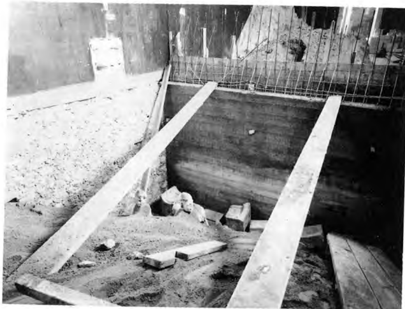
Λάκκος σὲ αἴθουσα τοῦ Ἐθνικοῦ Μουσείου, μισογεμάτος μὲ ἀρχαῖα σκεπασμένα μὲ ἄμμο. Διακρίνονται ἀκάλυπτοι οἱ δύο θρόνοι τοῦ μικροῦ ναοῦ τοῦ Ραμνοῦντος (ΕΑΜ 2672) καὶ τὸ κεφάλαι τοῦ ἀνδρικοῦ ἀγάλματος ΕΑΜ 1823 ἀπὸ τῆ Δῆλο.