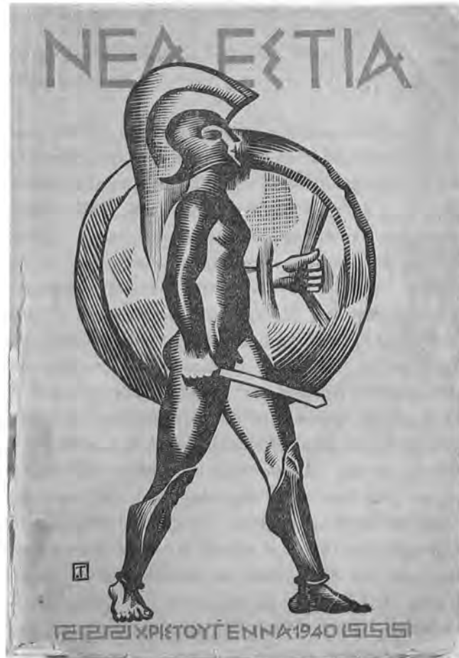
Τὸ ἐξώφυλλο τῆς Νέας Ἐστίας τῶν Χριστουγέννων τοῦ 1940 μὲ ξυλογραφία τοῦ Τάσσου, ποὺ εἰκονίζει ἀρχαῖο Ἕλληνα ὄπλιτη.