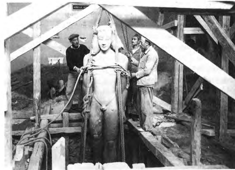
Ὁ κοῦρος τοῦ Σουνίου (ΕΑΜ 2720) κατὰ τὴν ἀπόκρυψή του κάτω ἀπὸ τὸ δάπεδο τῆς αἴθουσας τοῦ Ἐθνικοῦ Μουσείου, ὅπου ἦταν ἐκτεθειμένος.