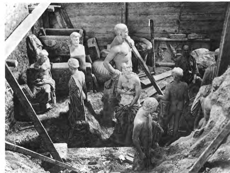
Λάκκος σὲ αἴθουσα τοῦ Ἐθνικοῦ Μουσείου, γεμάτος μὲ γλυπτὰ σὲ παράξενη σύνθεση. Ὁ κοσμητὴς Σωσιόστρατος, ὁ ἄγνωστος Ρωμαῖος καὶ ἡ Ἀφροδίτη φαίνονται σὺν τὰ τοὺς κατέχει ἀμνηχανία γιὰ τὴν παράξενη θέση τους.