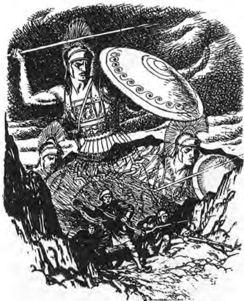
They Shall Not Pass

φέρει ἡ Μυθολογία καὶ ἡ Ἱστορία τῆς Ρώμης». Ὁ ραδιοφωνικὸς σταθμὸς τῆς Ρώμης, διὰ στόματος τοῦ Ἄλιμο Ρομέο, ἀπάντησε σβήνοντας ἀπὸ κάθε ἄποψη ἀπὸ τὶς σελίδες τῆς ἱστορίας ἀρχαίους καὶ σύγχρονους Ἑλλήνες: