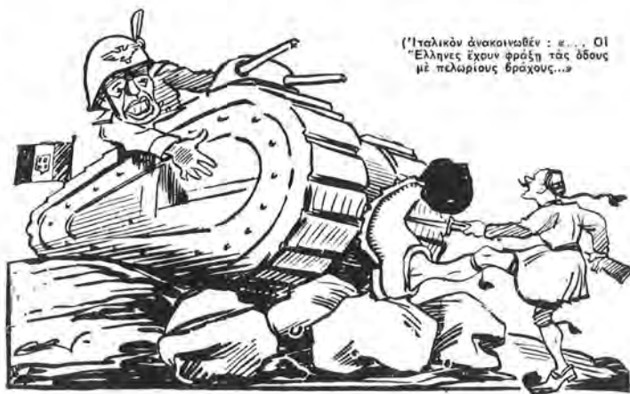
Φρατέλλοα. — Καθάρισέ μου τὸ δρόμο νὰ περάσω!... (Ἰπὸ κ. Ν. Καστανάκη)

Γελοιογραφία τοῦ Νίκου Καστανάκη («Ἐθνος», 6 Νοεμβρίου 1940).