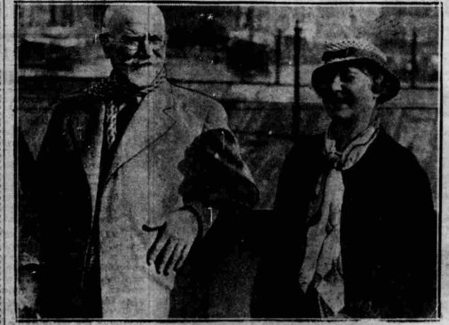
Μία από τις τελευταίες φωτογραφίες του Βενιζέλου με την σύζυγόν του, Κωνσταντήν κ' αυτός.